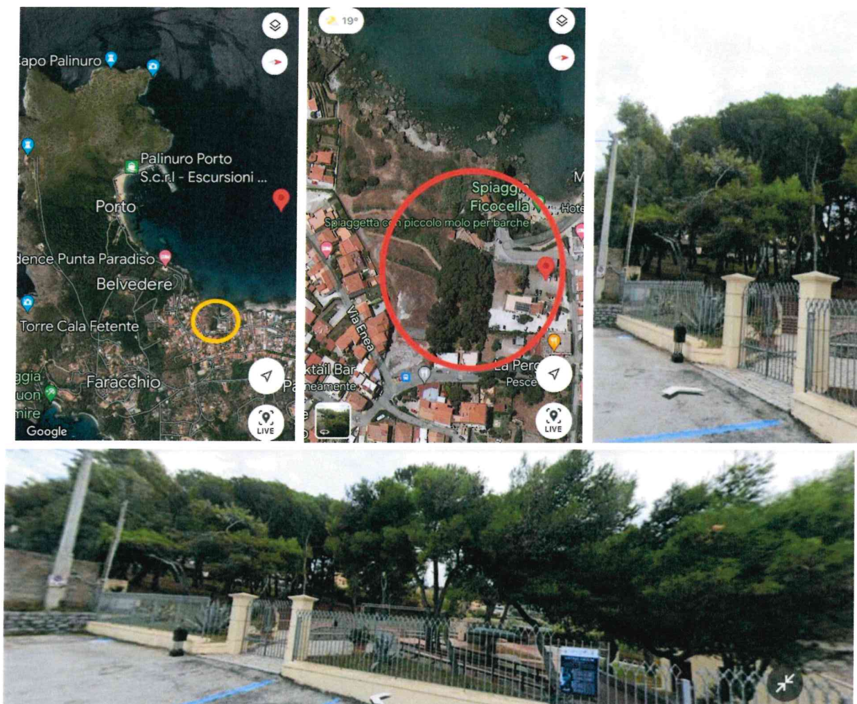
Localizzazione della pineta e suo stato originario