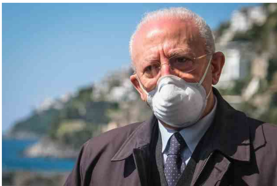
Il governatore della Campania Vincenzo De Luca

Esami e Tac cresciuti nel 2021 del 70% ma budget esauriti ed esami a pagamento Ancora al palo l'extra-budget promesso dalla