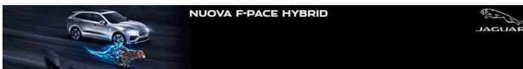
NUOVA F-PACE HYBRID