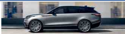
RANGE ROVER VELAR