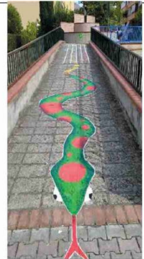
Le immagini del percorso al Parco degli Aranci